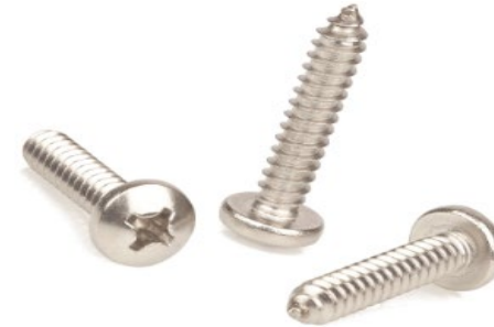
d) Type H — Cross recess